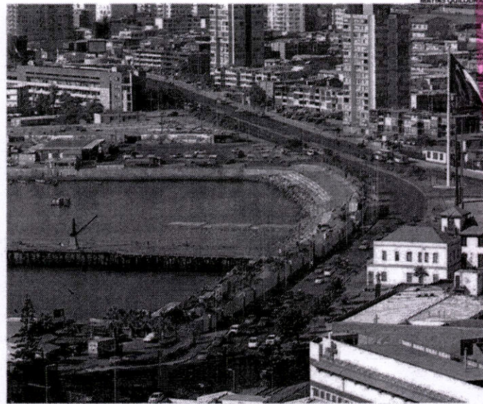
ANTOFAGASTA ESPERA CON TRANQUILIDAD EL FALLO DE LA CORTE INTERNACIONAL DE JUSTICIA.

Eso sí, la importancia estratégica de Antofagasta en este conflicto ha generado que algunas de las acciones del gobierno se