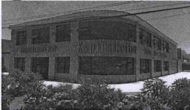
Figura 2. Área de fumadores a habilitar (entre muro y acera peatonal).

Como se puede apreciar en las imágenes anteriores, la implementación de la zona de fumadores, no impacta en el habitual uso de las aceras, ni de áreas de tránsito de las avenidas contiguas.